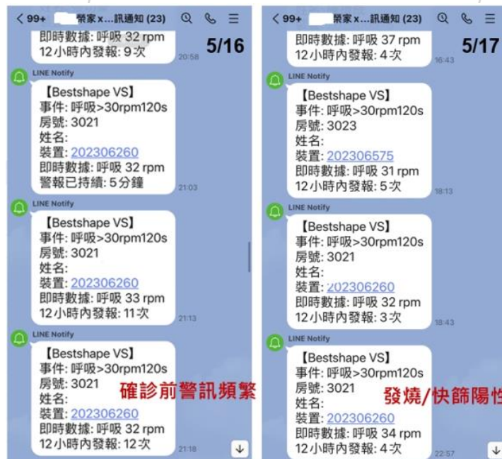
圖 4. 個案發燒、確診警訊主動發布