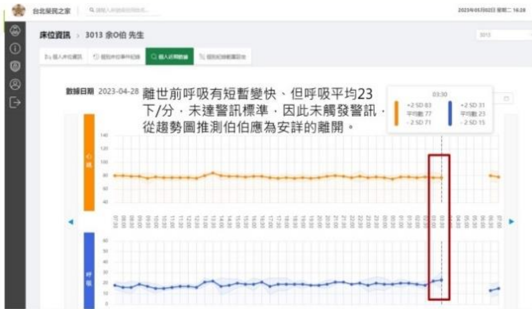
圖 5. 善終指標參考