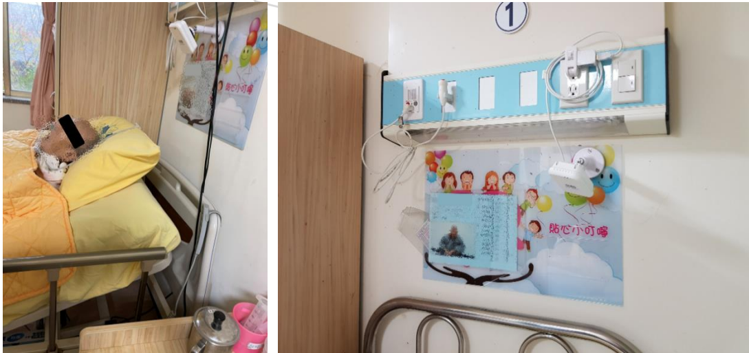
圖 3. 場域實際安裝狀況