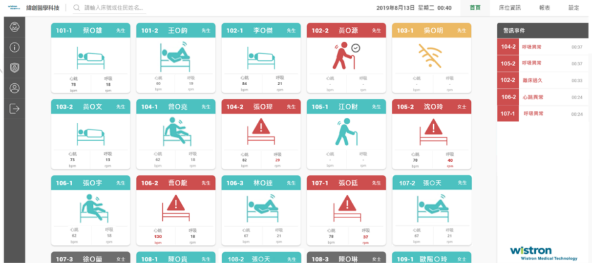
圖 2. 顯示畫面