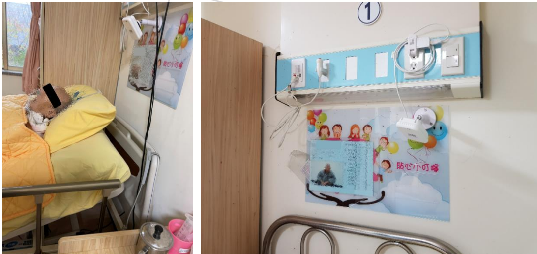
圖 3. 場域實際安裝狀況