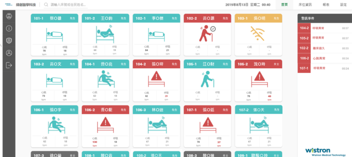
圖 2. 顯示畫面