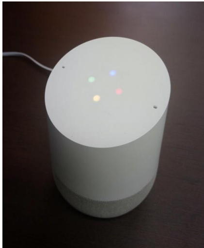
圖 2. 結合物聯網技術的語音助理 Google Assistant