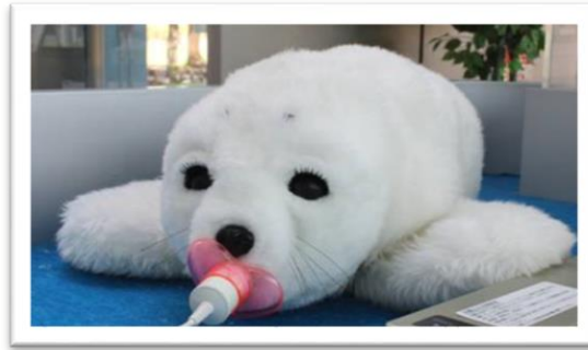
圖 1. 陪伴型機器人 Paro

得美國食品藥物管理局核可為醫療器材，2002 年被金氏世界紀錄大全譽為「最療癒的機械人(the most therapeutic robot)」，2013 年還被澳洲採用做為失智症非藥物治療法。