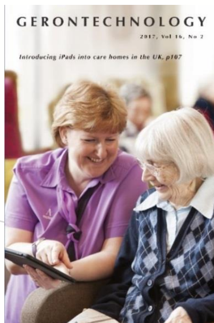
圖 4. 英國的「iPad 計畫」，將 iPad 實際引入養護機構

這個「iPad 計畫」成果發表於 Gerontechnology 國際學刊，並被選為當期封面（如圖 4），原因並不是其展現了先進的研發成果，而是這個計畫中展示了一個成功的模式，照護者如何利用現有智慧科技產品，依據自身問題、需求設計使用情境，讓智慧科技產品落實在高齡者生活與照護應用，內化成為照護流程的一部分。