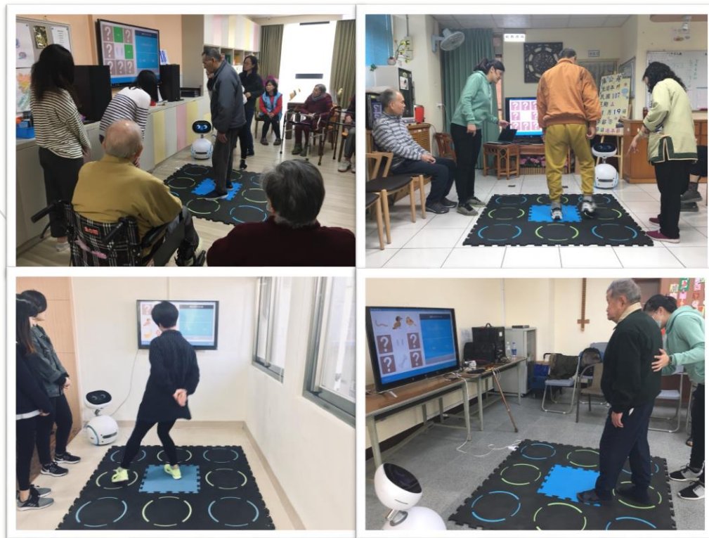
圖 9. 第三階段 Zenbo 與 WhizToys 配對遊戲結合開發失智症非藥物治療創新情境評估