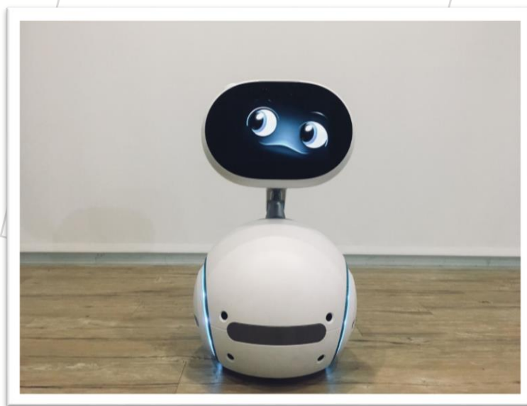
圖 2. 華碩電腦公司(ASUS)開發的機器人 Zenbo，是結合雲端自然語言處理引擎的陪伴型機器人

近年來人工智慧的興起，特別是「自然語言處理(natural language processing)」技術逐漸成熟、普遍，結合物聯網技術的語音助理如 Google Assistant、Amazon Alexa，甚至 iPhone Siri，都早已深入家庭，使用者可以用語音方式透過語音助理執行功能性任務（如開燈、關冷氣）或資訊查詢（如詢問天氣、路況），甚至只是一般閒聊(chatting)。Siri (Speech Interpretation and Recognition Interface) 是一款內建在蘋果 iOS 系統中的人工智慧助理軟體，雖然不是傳統意義上的有形機器人，但此軟體使用自然語言處理技術，使用者可以使用自然的對話與手機進行互動，完成搜尋資料、查詢天氣、設定手機日曆、設定鬧鈴等許多服務。但其目前僅支援特定 iPhone, iPad 及 iPod Touch 機種，觸及的使用者範圍有限。許多研發嘗試結合機器人和自然語言處理，開發可以自然對話的機器人，華碩電腦公司開發的機器人 Zenbo（如圖 2），就是結合雲端自然語言處理引擎的陪伴型機器人。