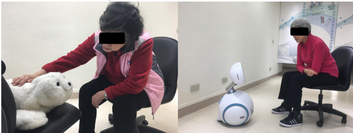
圖 3. 第一階段實驗：RUI 感受評估(Zenbo vs. Paro)