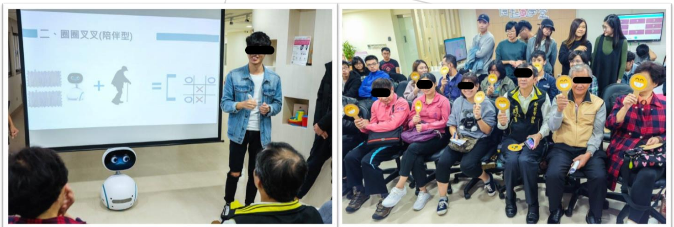
圖 7. 第三階段：Zenbo 長者居家應用創新使用情境設計展示與社區長者評估

運動對於提升高齡者生活品質、治療肌少症、延緩失智等均有重要意義(Birren et al., 2014; Denison et al., 2015; Forbes et al., 2015)，從 Zenbo 程式設計層面來講，也有很好的可行性及拓展性。開發 Zenbo 陪伴長者運動可能的功能可以從以下幾個方向著手：跟隨長者移動；帶動跳；陪長者一起運動，過程中鼓勵加油；偵測長者動作，如有錯誤給予姿勢糾正；運動結束，錄影存檔上傳。