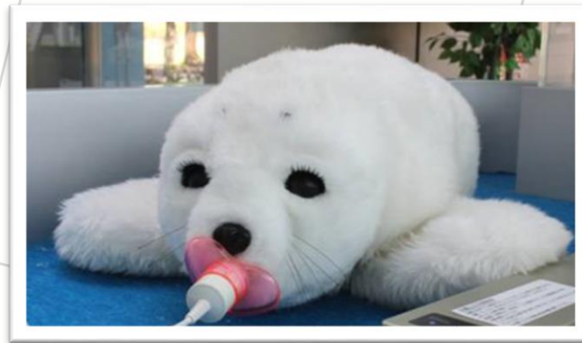
圖 1. 陪伴型機器人 Paro

隨著科技的進步，人們期望機器人能更貼近人類生活，提供更多樣化的服務，各種服務型機器人(service robots)開始蓬勃發展，嘗試以不同的角色融入人類的生活。在高齡者照護上，許多機器寵物、機器玩偶的開發，能與高齡者進行互動，確實有助於舒緩高齡者心理的孤獨感，再次感受到被需要的價值。陪伴型機器人從「心理慰藉機器人(mental commitment robot)」更進展到所謂「療癒型機器人(therapeutic robot)」，能對高齡者提供心理及精神層面的療癒效果，舒緩其壓力與孤獨感，甚至提供如失智症患者之心理療癒功能，提升其心理健康及生活品質。例如日本產業技術總合研究所基於「寵物療法」的靈感開發了海豹型機器人 Paro (如圖 1)，是最有代表性的陪伴型機器人，內部裝設有觸覺、光、聲音、溫度和姿態感測器，能依外界刺激產生各種自主性行為反應(autonomous behavior)，如聽到聲音會抬頭仰望、受到撫摸會揮舞前肢、擺尾轉頭、眨眼並發出叫聲。Paro 已取得美國食品藥物管理局核可為醫療器材，2002 年被金氏世界紀錄大全譽為「最療癒的機械人(the most therapeutic robot)」，2013 年還被澳洲採用做為失智症非藥物治療法。