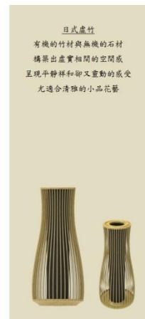
圖 3. 概念設計 1—圓滿意趣