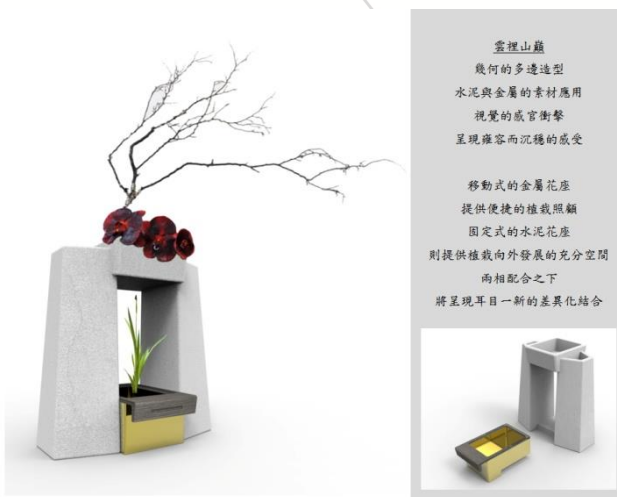
圖 7. 概念設計 5—雲裡山巔