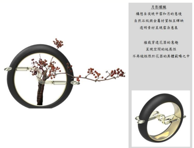
圖 8. 概念設計 6—月影朦朧