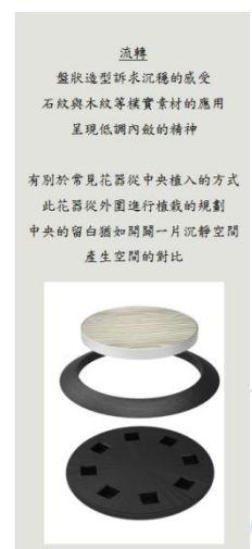
圖 5. 概念設計 3—畫中畫 瓶中品